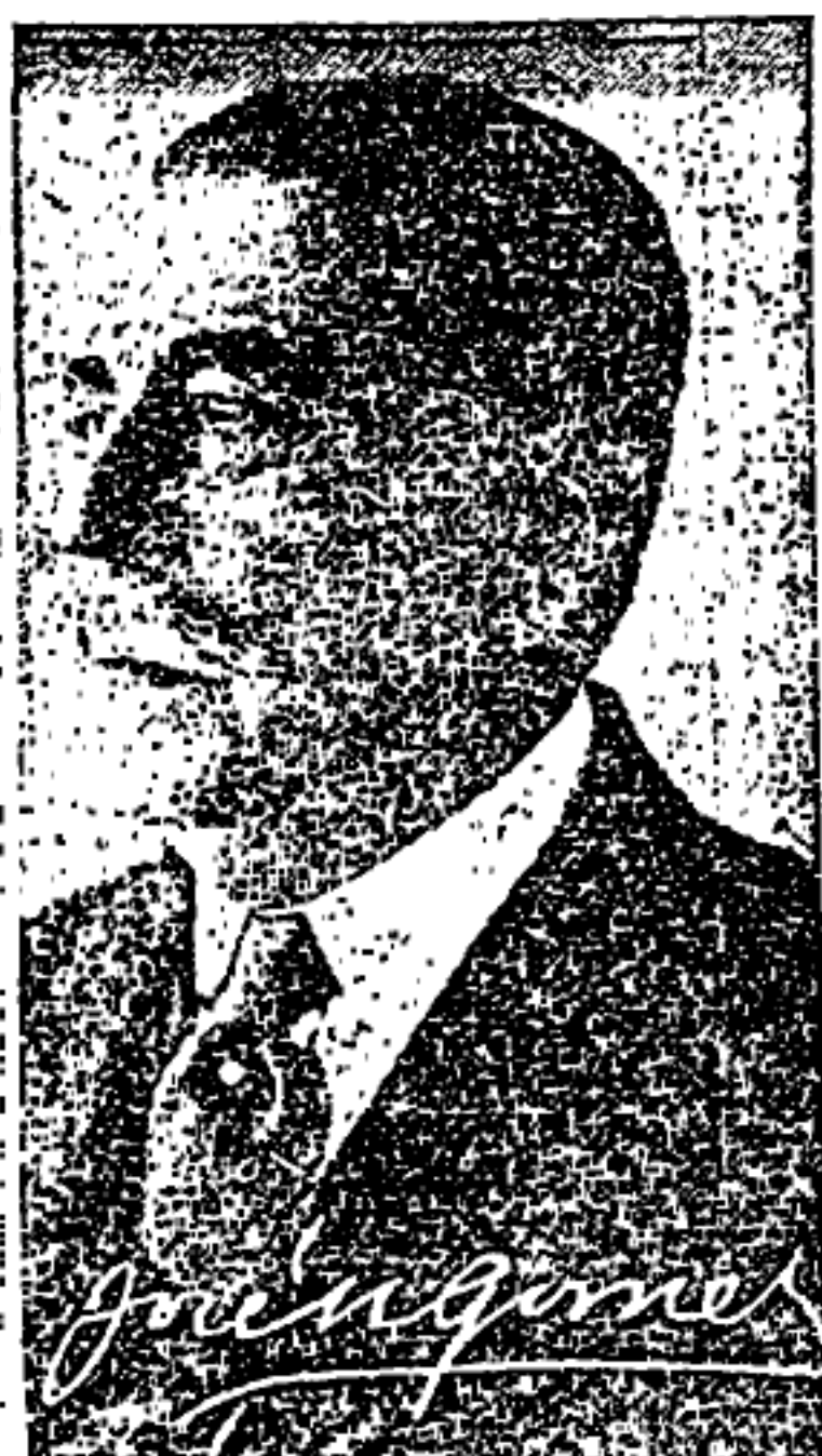
EL MAYOR GENERAL JOSE MIGUEL GOMEZ EX-PRESIDENTE DE CUBA, MURIO AYER

Se tiene entendido que el Secretario de Estado, Mr. Charles E. Hughes, espera que el Presidente Obregón, considere esa declaración como la única réplica que se puede dar a su contestación al ofrecimiento que