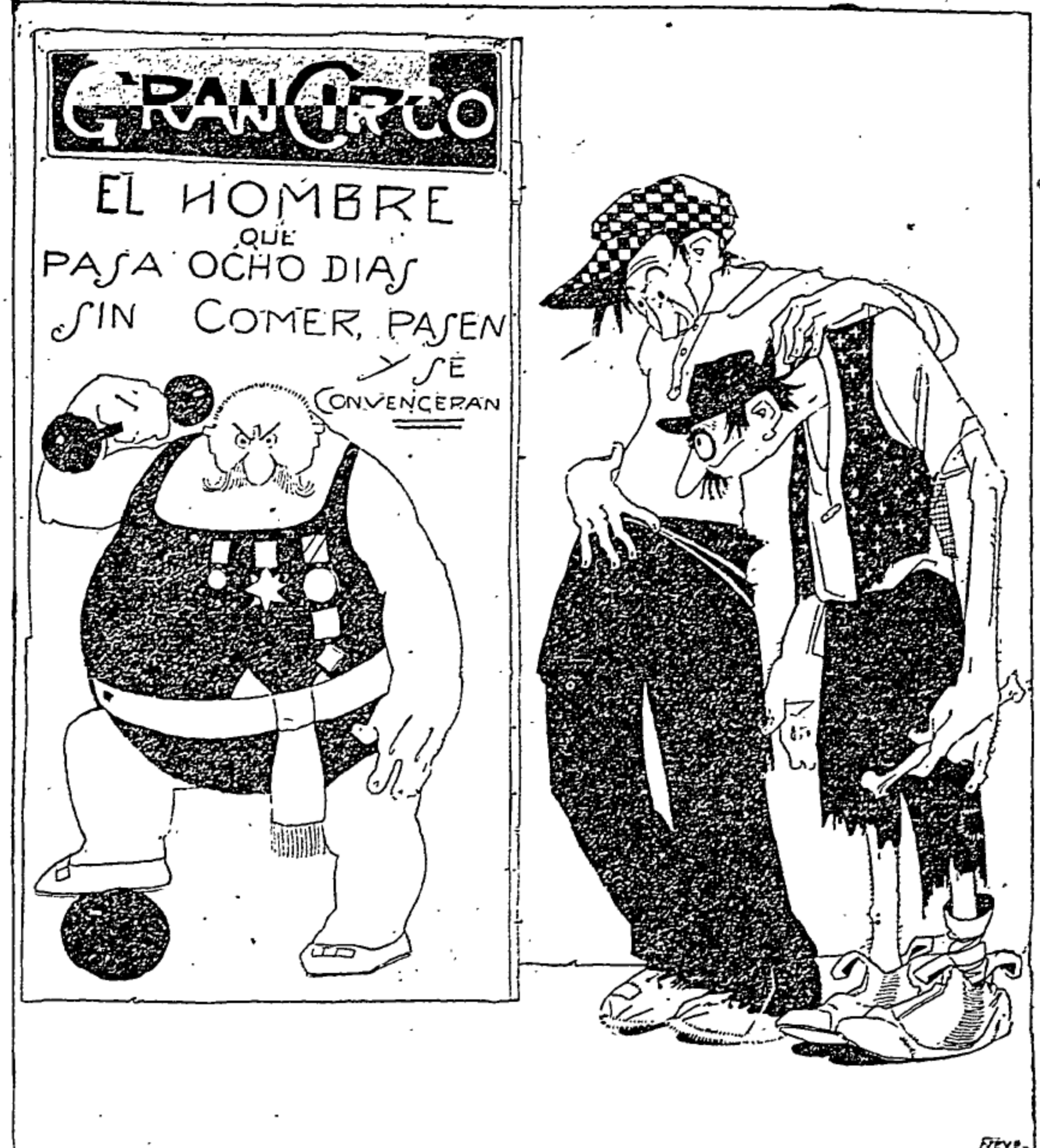
El del Chaleco—Mira Iano, al Hombre que se Está Ocho Días sin Comer, ¡Cuánto "Bombo" y Cuánta Medalla!... El de Cachucha:—Cuestión de Popularidad... ¡Nosotros no Comemos Hace Quince Días y ni Quien nos Diga Nada!